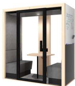
Tableau écriture extérieur